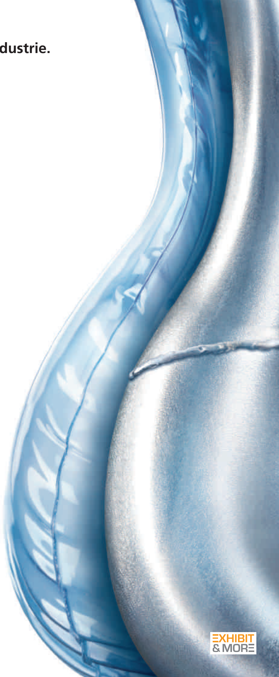
EXHIBIT & MORE